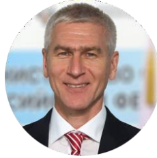
Министр Матыцин Олег Васильевич

Министерство спорта Российской федерации minsport.gov.ru